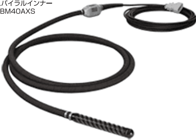
●スパイラルインナー HBM40AXS