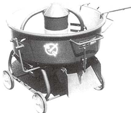
●モルタルミキサー TMU-3.5