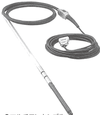
●マルチフレキシブル HBM30ZXLH