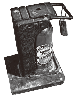
●オイルジャッキ 2t爪付