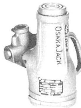
●ジャーナルジャッキ JJ-2513