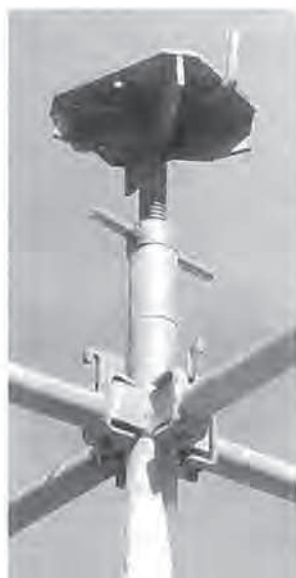
ヘッド部分・大引受ジャッキ。