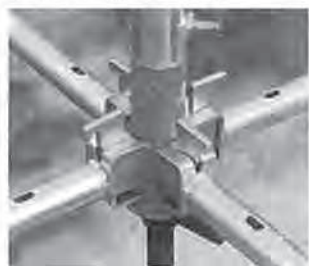
ベース部分・根がらみ用ポケット金具による緊結。