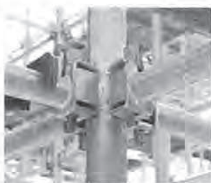
中間部分・縦横のつなぎ材。