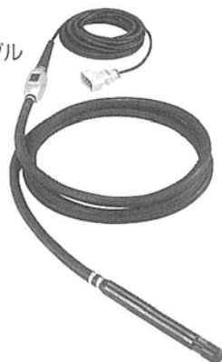
●高周波フレキシブル HBM40Z