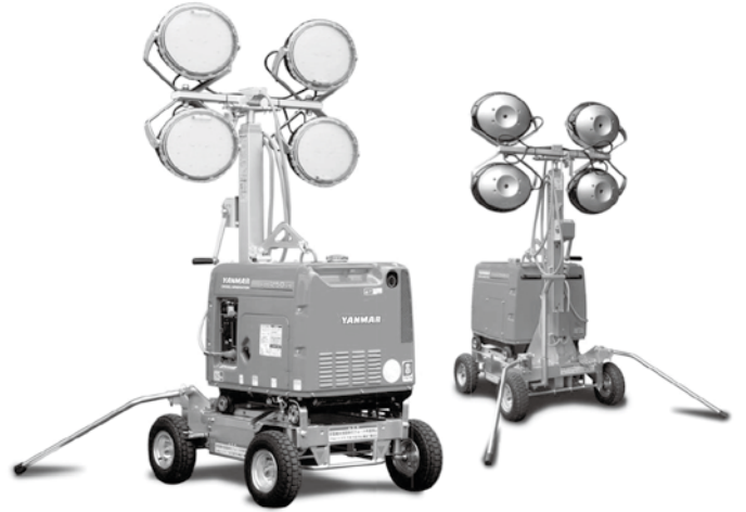
■発電機付サーチライト LED 4 灯